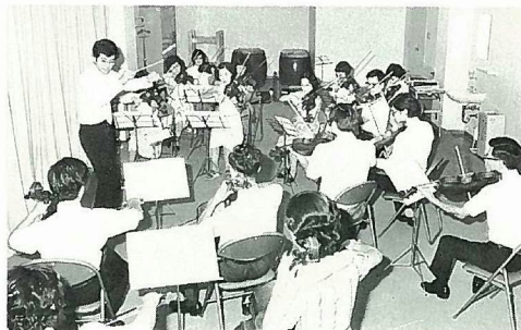
ビバルディ「四季」を試みる 昭和50年9月 第5楽屋にて

1日の仕事が終わりに、クタクタに疲れた時でも団員は皆この喜びを求めて第5楽屋に集まって来る。まさに音楽がメシより好きな連中なのだ。