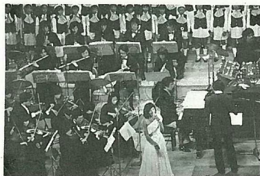
ゴールドブレンドコンサートより