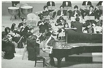
第4回定期演奏会より