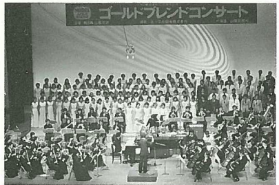
ゴールドブレンドコンサートより