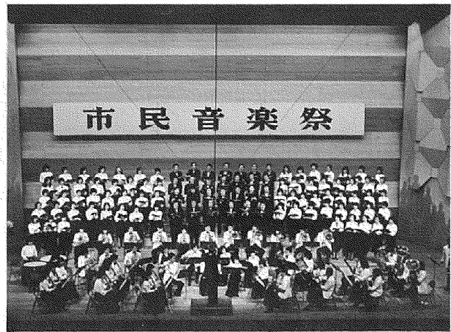
第12回倉敷市民音楽祭

合唱連盟が結成された当時、ホールらしきもの一つなかった倉敷に、やがて文化センター、ホールが出来、47年には全国的にも指折りの立派な市民会館が落成してからは、市民音楽祭の一般の部として合唱祭が続けられていますので、第1回から数えると今年で24回になります。この市民音楽祭は当時、小学校の講堂を使用して開催さ