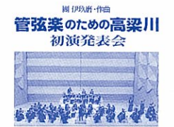
1980年:團伊玖磨・管弦楽のための高梁川