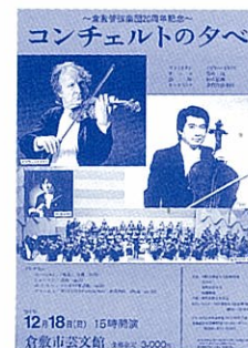
1994年:20周年記念コンチェルトの夕べ