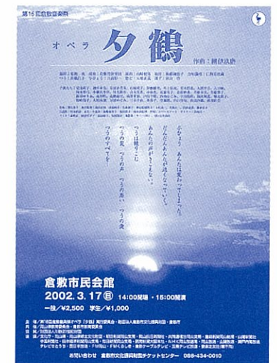
2002年:團伊玖磨・オペラ「夕鶴」