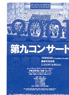
2001年:第九コンサートin倉敷