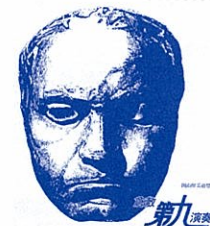
1975年:第1回定期演奏会