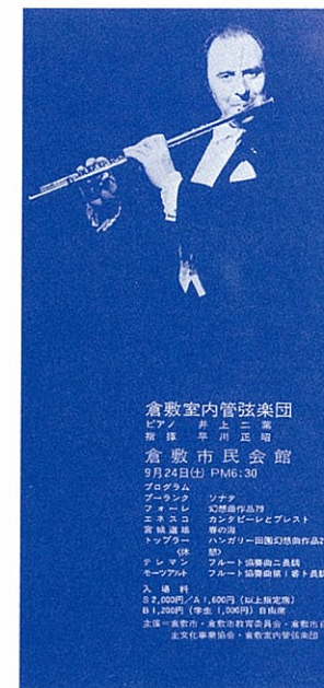
1977年:ランパルと管弦楽の夕べ