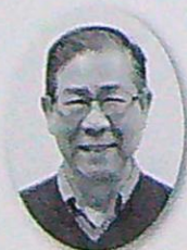
照明 大塚 和真

バレエ振付補助：高本 玲子 衣裳アシスタント：木場絵里香 舞台監督助手：井上 瑞穂 ：大井麻有実 フライヤーデザイン： 活文堂印刷株式会社