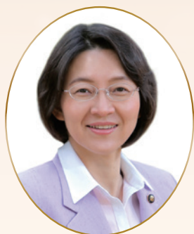
倉敷市長 伊東 香織

第40回倉敷音楽祭「倉敷管弦楽団演奏会」の開催にあたり、ごあいさつ申し上げます。