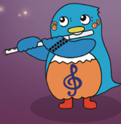
マスコットキャラクター ♪くらっカン♪